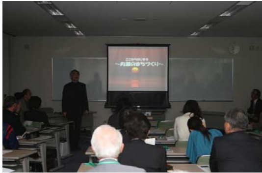
まちづくりキックオフ講演会の様子