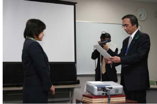
町長から委員に委嘱状が交付されました