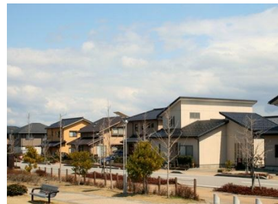
定住が進む白帆台ニュータウン

町内における住居の取得等に対する支援や空き家の有効活用、地域の移動を支える公共交通環境の充実等を推進し、U I J ターンをはじめとする移住者の受け入れ環境を整備します。