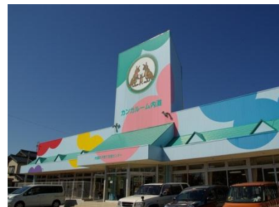
子育て支援センター カンガールーム内灘

結婚・妊娠・出産に対する若者の希望がかなえられるよう、若者の出会いの場の創出や妊娠や出産に対する不安軽減等への支援体制の充実等を図り、本町において安心して家庭を築くことができる環境を整備します。