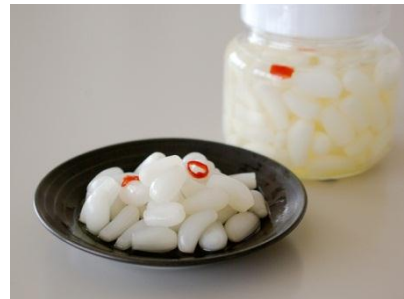
特産品であるラッキョウ

また、新規企業の誘致や創業支援を実施し、町内における新たな産業構造の形成、地域の活性化、雇用の創出を図ります。